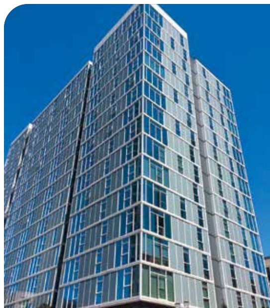
Hoyt Street Yards No. 2 | Portland, Oregon, EUA | Arquitecto: Bora Procesador Certificado Vitro: Vitrum Industries Ltd.

El vidrio Solarban® Acuity™ también es ideal para aplicaciones distintivas como atrios, domos, y vidrios spandrel (entreplantas).