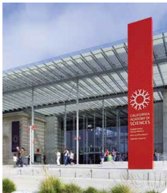
California Academy of Sciences | San Francisco, California, EUA Arquitecto: Renzo Piano Building Workshop and Stantec Architecture.